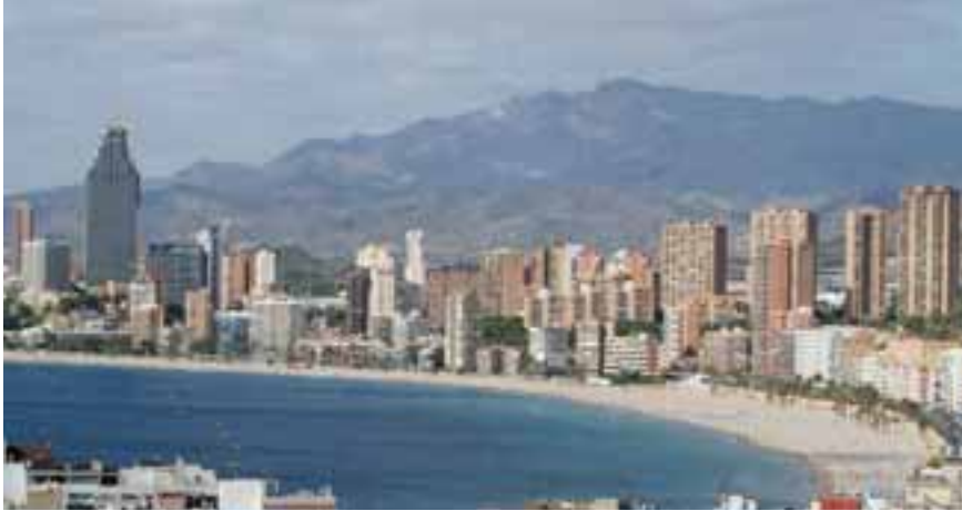
Los datos de 2009 colocan a la ciudad muy por encima del resto de destinos turísticos valencianos

G.N.- Benidorm y la Costa Blanca continúan siendo los motores indiscutibles del turismo de la Comunidad Valenciana. Esta es la conclusión que se desprende del estudio Hosbec Monitor que por primera vez ofrece sus datos anuales relativos a 2009. Según este estudio en Benidorm y la Costa Blanca se concentra el 51% de la oferta de alojamiento hotelero, pero se realizan casi el 60% de todas las pernoctaciones hoteleras de la Comunidad Valenciana. Además el 54% de todos los trabajadores empleados en hoteles prestan sus servicios en los establecimientos de Benidorm y resto de la provincia, reafirmando los datos provisionales ya anunciados por Hosbec Monitor de los meses de octubre y noviembre.