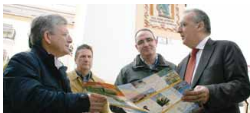
El alcalde descubrió ayer la primera de las placas que identifican dicha ruta hacia Santiago