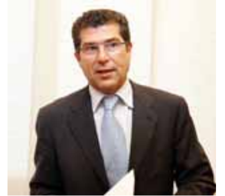
Ambos tienen problemas para encabezar las listas de los dos grandes partidos

general de los populares locales, fortalecida en la crisis interna que atraviesa su partido, dará la batalla hasta el final apoyada por el presidente provincial, José Joaquín Ripoll.